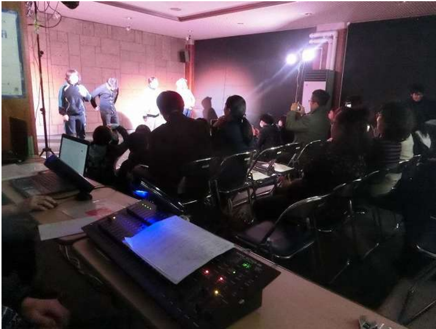
青年団体「U 25」の青年センターロビーでの公演風景