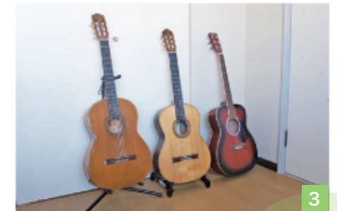
1 青年センターフェスティバル2017でのフラメンコギター独奏の場面。 2 生徒さんと一緒に「空も飛べるはず」等の弾き語りを披露。 3 武田さん愛用のギター。左からフラメンコギター、クラシックギター、アコースティックギター。右のギターが初めて購入したもの。