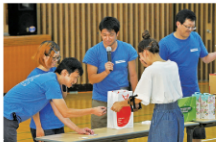
14 お待ちかねの大抽選会。こちらの方は「お鍋&スープセット」をゲット! おめでとうございます!