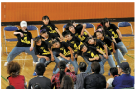
8 このステージを見て、「ダンスやりたい!」とお願いした子もいたようです。