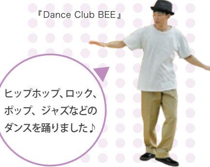
『Dance Club BEE』