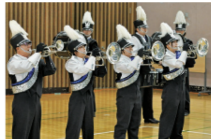
5 迫力あるマーチングにみんな圧倒されていました。