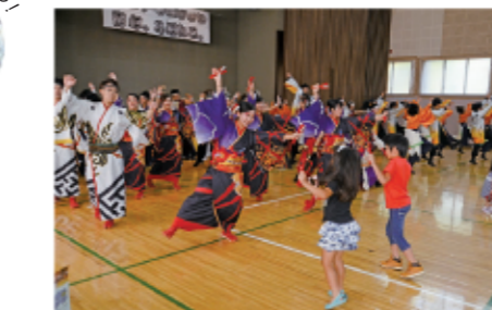
3 会場の子どもたちと一緒にYOSAKOI♪