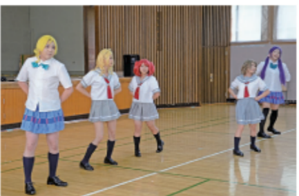
10 女性チームと女装チームのコラボレーションです。