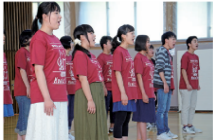
12 キレイなハーモニーにみんな聴き入っていました。

ご来場いただいた皆さまからは、「とても楽しかった」「どれもおいしかった」「若者の元気な姿を見たら元気になった」「一生懸命な姿に感動した」など、青フェスからエネルギーをもらったという声を多くいただきました。来年はさらにパワーアップして、たくさんの方に感動を与えられる青フェスを目指したいと思えます！ (中村友美)