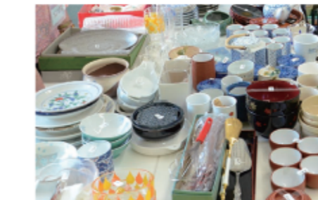
4 毎年行列ができるバザー。掘り出しものがたくさん!