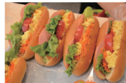
2 おいしいと評判のベジドッグは即完売!