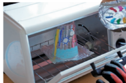
6 絵を描いたプラコップを加熱してコースター作り。