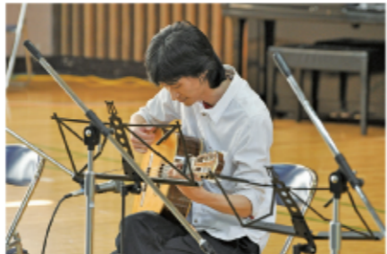
7 情熱的なフラメンコギターで会場を魅了