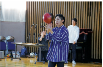
11 「すごい!」という子どもたちの歓声が響いていました。