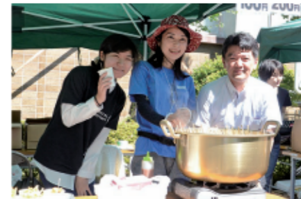
1 暑い日だったけど、味噌こんにやくは大人気でした！