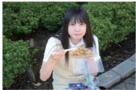
9 「焼きそば、おいしいです♡」