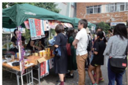
13 露店の様子。どこも大繁盛でした！